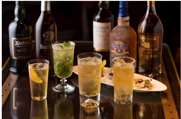
オークハイボール イメージ

東京駅丸の内駅舎の中に位置する東京ステーションホテル(所在地:東京都千代田区 1-9-1)では、初夏から夏本番にかけてバー&カフェ「カメリア」にてフレッシュフルーツを使ったカクテルを、バー「オーク」にてオリジナルハイボールをご提供いたします。(カメリアのカクテルはノンアルコールでもご用意可能)。これからの季節、ホテルバーのカクテルで「大人な夏時間」をお過ごしいただけます。