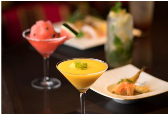
フレッシュフルーツカクテル イメージ