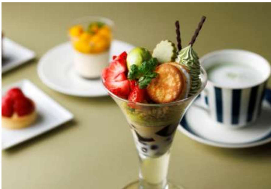
抹茶パフェ イメージ

東京駅丸の内駅舎内に位置する東京ステーションホテル（所在地：東京都千代田区丸の内1-9-1）は、館内1Fにあるロビーラウンジにて創業300年を誇る京都の老舗の抹茶をつかった和風パフェを4月1日（月）より提供いたします。