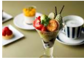
抹茶パフェ イメージ