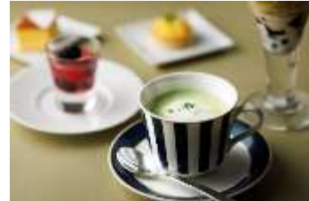
抹茶ラテ イメージ