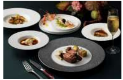
「レストラン ブラン ルージュ」ムニウド ノエル イメージ

心ときめくクリスマスの夜、厳選された高級食材を贅沢に使用したスペシャルコースをご用意いたしました。三大珍味をはじめ、阿古屋貝、雉、ノドグロなど、希少な食材の個性と旨みを丁寧に引き出し、岩手県産前沢牛を主役に据えた至極のディナーをお届けします。※エトワール ド ノエル（23,000 円）、ムニウド ノエル レジェ（17,000 円*12/24 ディナーを除く）もごさいます。