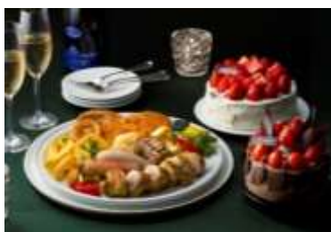
クリスマス パーティーセット盛り付け例

クリスマスケーキをご購入のお客様には、特別に「クリスマス パーティーセット」をオプションでご用意！ジューシーで香ばしいチキンは、食卓のメインディッシュとして華やかさを一層引き立てます。みんなでワイワイ楽しめる、3〜4名さままでシェアできるボリュームたっぷりのセット。今年のクリスマスを、ケーキとホテルメイドのメインディッシュでさらに思い出深いひとときにしませんか？