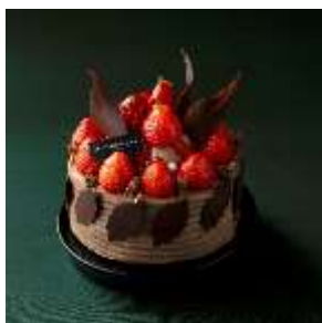
クリスマス チョコレートショートケーキ