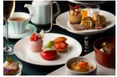
クリスマスアフタヌーンティー タイムレスエレガンス イメージ

ヨーロッパクラシックのインテリアが落ち着いた空間のロビーラウンジでは、クリスマスアフタヌーンティーをご用意します。縦長窓から望む、煌めく丸の内の街並みが、クリスマスの華やぎを感じさせます。4種のセイボリーのなかでも、仙台牛ハンバーグ & 本ずわい蟹ピラフは、クリスマスにふさわしい贅沢なひと皿。さらに、ムースショコラ ピスターシュやフローズンシュークリーム、いちごのロールケーキなどクリスマスカラーのスイーツが、目にも舌にも楽しい甘美な時間を演出します。