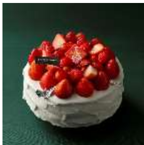
クリスマス ショートケーキ