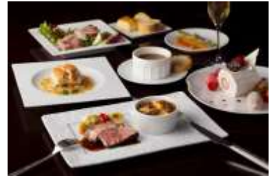
「バー&カフェ カメラリア」トウインクルクリスマス イメージ

全 6 品のフルコース。黄金いくらを添えたスモークサーモンのオードブルや、七面鳥とフォワグラのテリーヌが、クリスマス気分を一層盛り上げます。誰からも親しまれるオニオングラタンスープの後に魚料理や肉料理が続き、締めくくりにはブッシュ・ド・ノエルがテーブルを彩ります。※プティトウインクルクリスマス（11,000 円～）のご用意もごさいます。