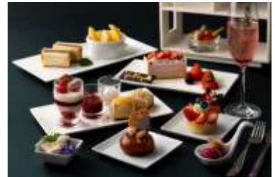
「アトリウム」クリスマスアフタヌーンティー イメージ

アトリウムで大人気のアフタヌーンティー。今年はクリスマス期間だけのスペシャルアフタヌーンティーをご用意します。七面鳥やいちごが主役のスイーツなど、クリスマスに華やぎを添えるアイテムを取り揃えました。普段は宿泊ゲストだけがご利用いただけるゲストラウンジで心温まる優雅なティータイムをお過ごしください。