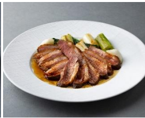
合鴨和風ロースト