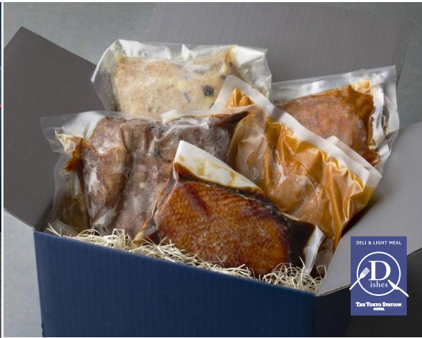
父の日 美食を贈る惣菜5点セレクション