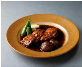
津軽どりもも肉のグリル照り焼き 山椒風味

身質が柔らかい北海道産ホワイトチキンの希少部位 肩小肉を使用。数種類のスパイスをブレンドした香り高い本格派のオリジナルカレーに仕上げました。