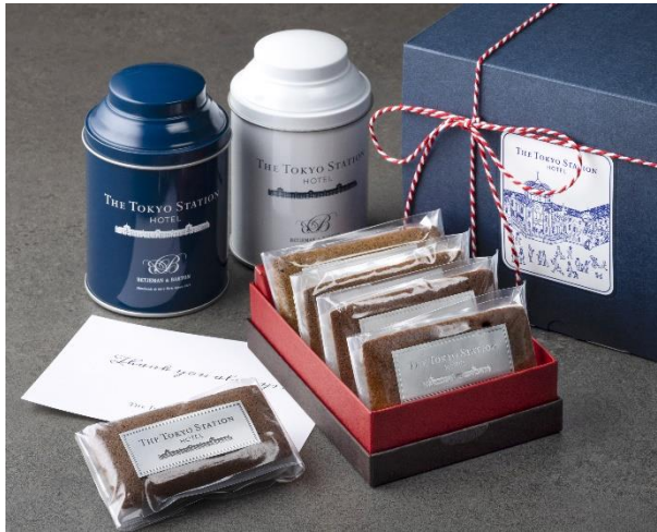
母の日 麗しき感謝のティーセット