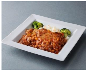
ポーク煮込み プロヴァンス風