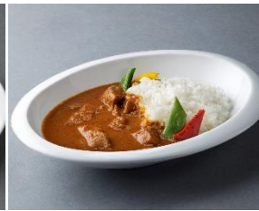
スパイス香る北海道チキンカレー

※ご購入はこちら： 美食を贈る惣菜 5 点セレクション | 公式オンラインショップ