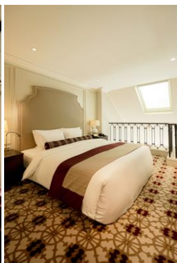
メゾネットキング

重要文化財の中で過ごす優雅な時間。駅直結という利便性を備えながらも、一歩足を踏み入れればそこはまるで別世界！ゆったりとしたご滞在で、心身ともにリフレッシュいただけます。チェックイン時にお配りしているフロアガイドを手に、館内を探検しながら100点以上展示されているアートワークをお楽しみください。