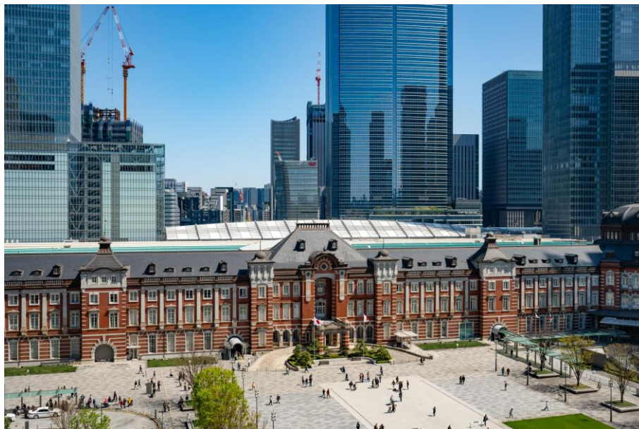
窓の外に広がるGWの喧騒を客室からゆったり眺めるのも贅沢な体験！

東京ステーションホテルでは、百余年の歴史ある空間とともに、ゴールデンウィークをより充実させてお過ごしいただける多彩なプランをご用意しております。都心にいながら非日常を感じるひととき、そして大切な方との特別な時間を演出するおすすめの過ごし方をご紹介します。