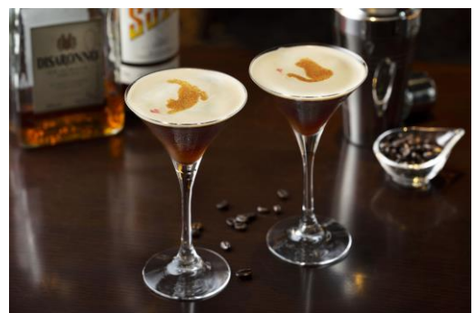
タイアップカクテル Présence Noir（プレザンス・ノワール）

深い余韻のカクテルです。ベースには、かつてピカソにも愛されたとされるスーズを。特有のほろ苦さが、エスプレッソの苦味と交差し印象的な余韻を生み出します。リキュール〈アマレット〉を合わせることで、相性の良さが引き立ち奥行きのある味わいに。グラスの中から、いまにも黒猫が飛び出してきそうな心躍る一杯。どんな“猫”に出会えるか、お楽しみに。