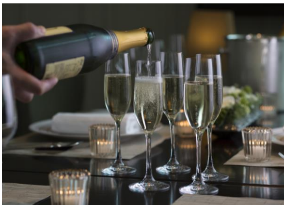
シャンパーニュで乾杯イメージ

お食事もシャンパーニュも、お仲間でにぎやかに MATSUKIN@Atrium ゲストラウンジ〈アトリウム〉