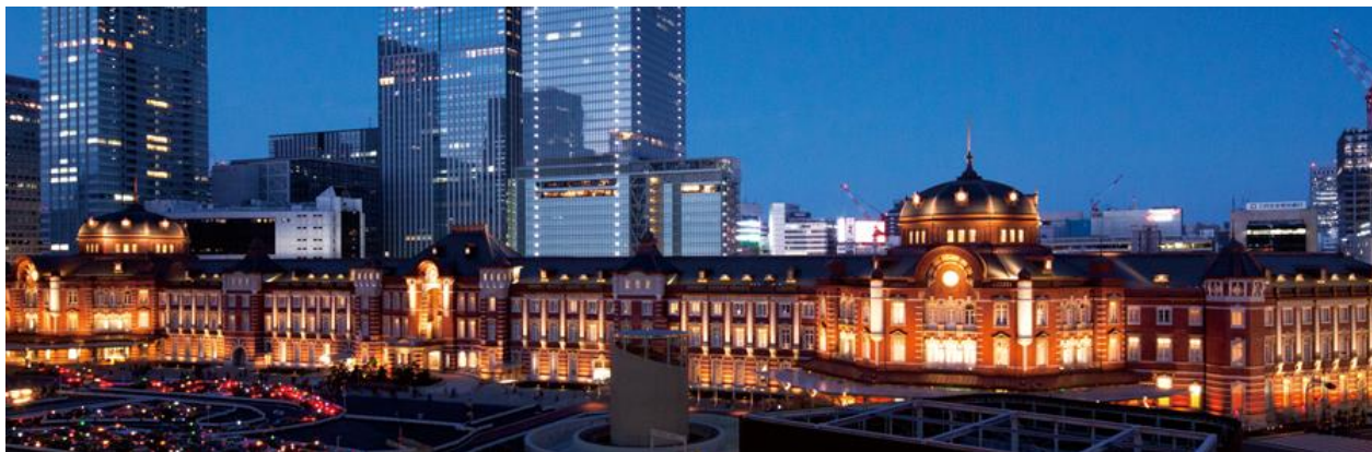
東京ステーションホテルが位置する東京駅丸の内駅舎

東京駅丸の内駅舎の中に位置する東京ステーションホテル(所在地:東京都千代田区丸の内 1-9-1)では、2月24日(金)から全国各地で実施される「プレミアムフライデー」に参画し、同日から3日間限定で“ ちょっと贅沢 ”にお過ごしいただけるプロモーション「 プレミアムフライデー@The Tokyo Station Hotel 」を開催いたします。直営5店によるレストランプランと宿泊プランは、“Happy Premium Friday!”とプレミアムフライデーをお楽しみいただけるよう、すべてに シャンパーニュでの乾杯 が付いています。歴史的建築物内のホテルという非日常の空間で、お仕事帰りに優雅なひとときをお楽しみいただけます。