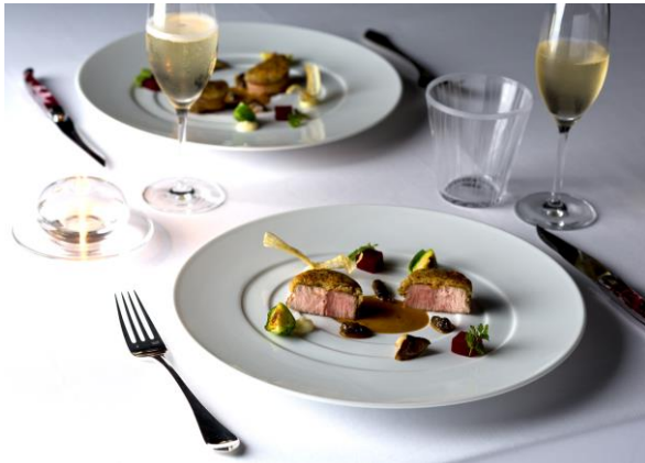
ブラン ルージュの料理イメージ

ホテルディナーをじっくり堪能 Menu Soirée - ムニュ ソワレ レストラン〈ブラン ルージュ〉