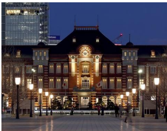
イベント会場は東京ステーションホテル バー&カフェ(カメリア)