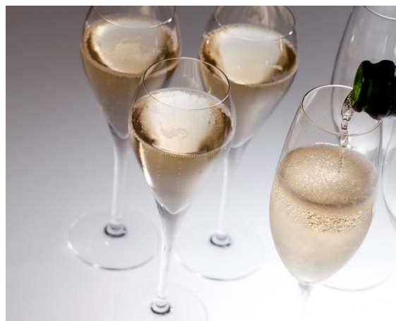
シャンパーニュのフリーフロー付

東京駅丸の内駅舎の中に位置する東京ステーションホテル(所在地:東京都千代田区)は、ホテル初のカウントダウンイベント「TSH COUNTDOWN PARTY 2017 to 2018 at Camellia」を、2017年12月31日(日)にバー&カフェ(カメリア)で開催いたします(1名様 10,000円/税サ込 *カメリアで販売するチケットは割引価格で9,500円)。