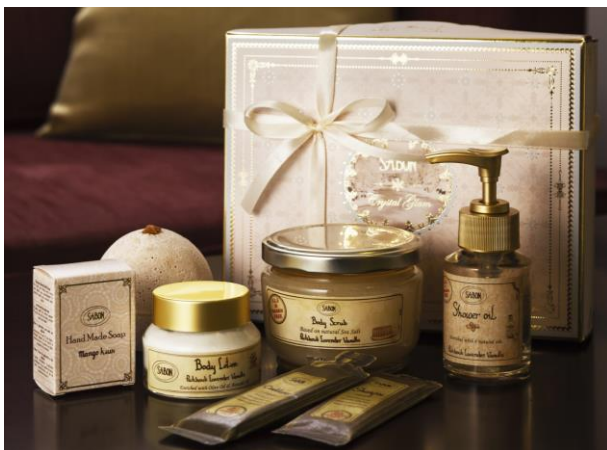
宿泊プラン限定の SABON ギフトセット

「SABON」は、ミネラル豊富な死海の塩や自然由来の素材のみを使い、“ギフト”の意味を重要視したお洒落なパッケージデザインにこだわるだけでなく、「人が幸せになるようなライフスタイルの提案」を目指す、自然派ボディケアブランドです。当ホテルはその姿勢に感銘を受け、リニューアルオープン後初めてボディケアブランドとコラボレーションいたしました。ギフトセットの商品は、両社の女性チームが選定。国内外のセレブリティから評判の高いボディスクラブをはじめ、手作りソープ、シャワーオイル、バスボール、ボディローション、ヘアシャンプー&コンディショナー(使い切りサイズ)と、心身共に潤うバスタイムをお楽しみいただける贅沢なラインナップです。お客様への“ギフト”として、特別に華やかなクリスマス限定ボックスでお渡しいたします。