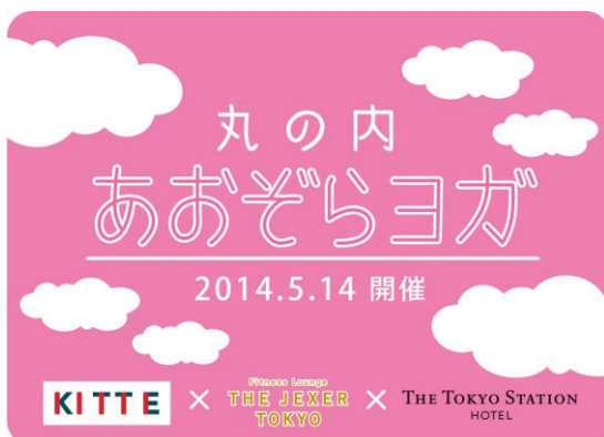
「丸の内あおぞらヨガ」

「丸の内あおぞらヨガ」のメイン会場は、東京駅赤レンガ駅舎から近い商業施設KITTE。屋上庭園「KITTEガーデン」で行う初めてのイベントとなります。丸の内の高層ビルや赤レンガ駅舎を目の前に、開放感溢れる場所でプロのインストラクターによるヨガレッスンをお楽しみいただけます。その他、東京ステーションホテル内の会員制フィットネスラウンジ「Fitness Lounge THE JEXER TOKYO」の温浴施設利用、KITTE内の3店舗と東京ステーションホテルの「ロビーラウンジ」から選べる朝食、ヨガマットレンタル、プレゼントなど、充実した特典が付いています。いつもの通勤スタイルで、お仕事前に手軽にご参加いただけます。