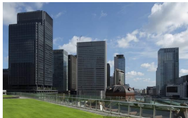
「KITTEガーデン」から望む丸の内の景色