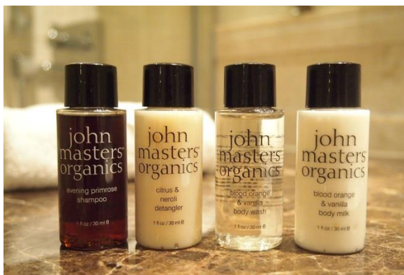
ジョンマスターオーガニック トラベルキット