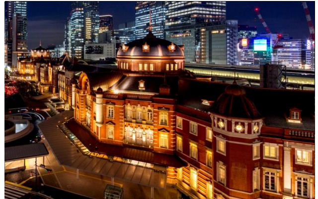
東京ステーションホテルが位置する丸の内駅舎

東京ステーションホテル(東京都千代田区丸の内 1-9-1)は、地域連携の一環として、東京の中心地・丸の内で開催される「大丸有打ち水プロジェクト 2014」に参加するお客様向けに、宿泊プラン「浴衣で楽しむ東京丸の内盆踊り 2014」(7月25日(金)/2名1泊1室 48,090円~)を7月2日(水)から販売開始いたしました。