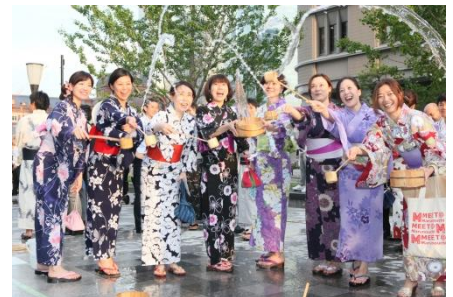
丸の内 de 打ち水 2013の様子