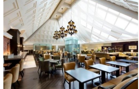
宿泊者専用のゲストラウンジ「アトリウム」