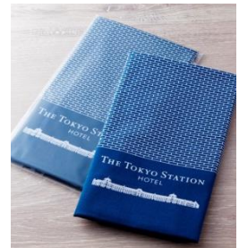
ホテルオリジナルの手ぬぐい

東京ステーションホテルは、本イベントの主旨に賛同し、 地域連携の一環 として、「大丸有打ち水プロジェクト 2014」に参加されるお客様向けに宿泊プランを販売。 プラン「浴衣で楽しむ東京丸の内盆踊り 2014」は、宿泊人数分の浴衣レンタル(着付け含む)が特典に。 浴衣姿で赤レンガ駅舎前の夏まつりをゆっくりお楽しみいただき、 イベント終了後も浴衣姿のままホテル内でお過ごしいただけます。 翌日は、ホテルのゲストラウンジ「アトリウム」で約70種類のお料理がずらりと並ぶブレイクファストbuffetをお楽しみください。普段使いにも最適な 東京ステーションホテルオリジナルの手ぬぐいをご人数分プレゼント いたします。