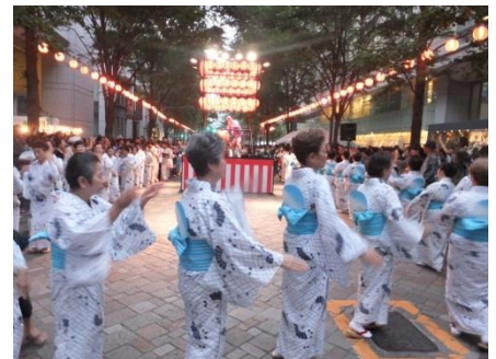
東京丸の内盆踊り 2013の様子