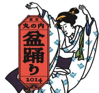
東京丸の内盆踊り 2014 のロゴ