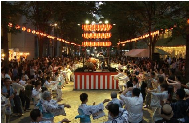
東京丸の内盆踊り 2013の様子