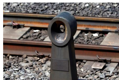
Scene2 ゼロキロポスト (イメージ)

新幹線や東海道線、中央線、総武線などの起点は全て東京駅。その位置を示すのが「ゼロキロポスト」です。中でも1969年に設置された4番線と5番線の間にある“ブロンズ製ゼロキロポスト”をじっくりと見学。「東京駅が日本の鉄道の起点」を感じる体験です。