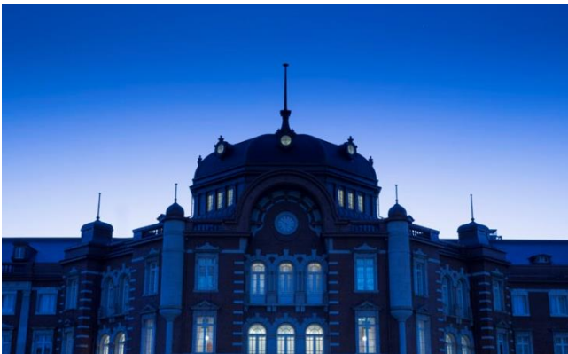
東京駅丸の内駅舎