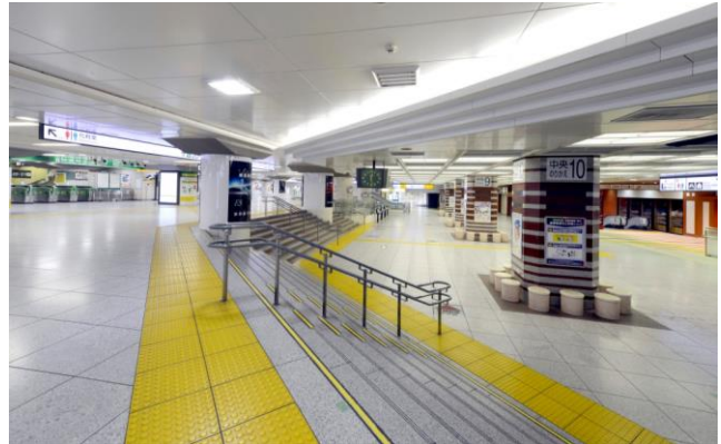
東京駅ミッドナイトツアーイメージ (一般のお客様のいない東京駅構内)

東京ステーションホテル(東京都千代田区丸の内 1-9-1)は、2014 年 12 月 20 日(土)に東京駅が開業 100 周年を迎えるにあたり記念企画として、終電後一般のお客様がいない東京駅のツアーをご体験いただける初の宿泊プラン「オトナの東京駅物語」(1 室 1 名様 46,000 円/税サ込)を、2014 年 8 月 25 日(月)より販売いたします。