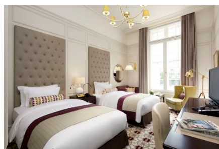
パレスサイドスーペリアツイン A