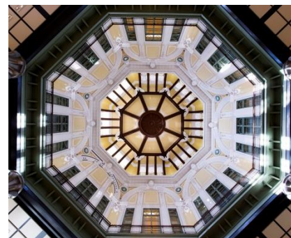
Scene3 南ドームレリーフの天井

普段改札口を行き交う人々で賑わう南ドーム1階。東京駅の外に繋がる出入口のシャッターを閉めたあとは無人に。床に横になると、2012年に復原されたドームレリーフの美しい姿が目の前に広がります。東京駅スタッフの説明とともにご覧いただける貴重な体験です。(記念撮影あり)