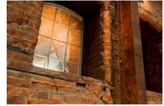
宿泊者専用のゲストラウンジ「アトリウム」の赤レンガ壁

宿泊者専用エリアのゲストラウンジ「アトリウム」やドームレリーフが比較的近に見える「アーカイブバルコニー」、東京駅の中央に位置し窓から行幸通りが見渡せる特別室「ロイヤルスイート」など、総支配人自らセレクトしたホテルエリアをご案内いたします。（希望制）