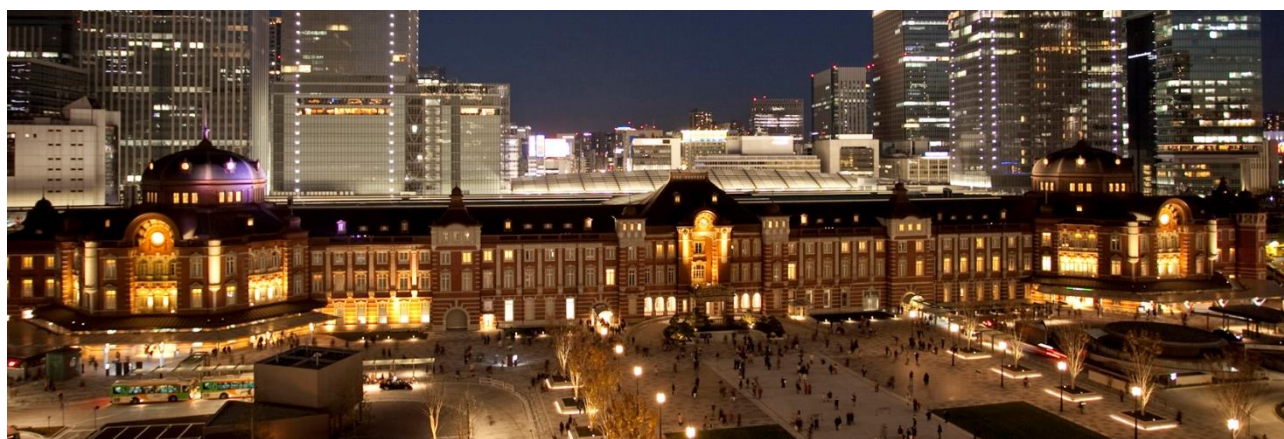
平成最後のカウントダウン会場となる、東京駅丸の内駅舎の中のホテル

- 2018年11月2日(金)10:00から、Webサイトにて参加申込受付スタート！ -