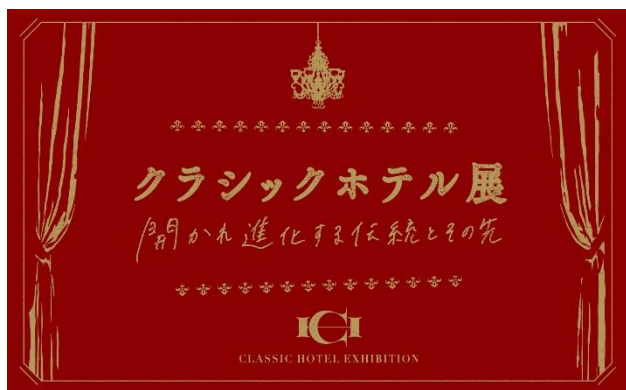
「クラシックホテル展」キービジュアル