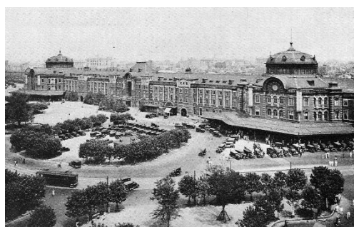
東京ステーションホテル開業時の東京駅丸の内駅舎

本展では「空間に蓄積される“ものがたり”」に焦点を当て、時代を超えて愛され続けるクラシックホテルだからこそ有する建築的・社会的・文化的価値が、図面や写真、映像、言葉、グラフィックでひも解かれます。クラシックホテルを通して、建物や空間・そして文化を“継承する”とはどういうことかを考察する、今までにない企画展です。1915年開業の東京ステーションホテルを含め、国内11もの歴史あるホテルが一堂に展示されるのも本企画の見ごたえの一つです。