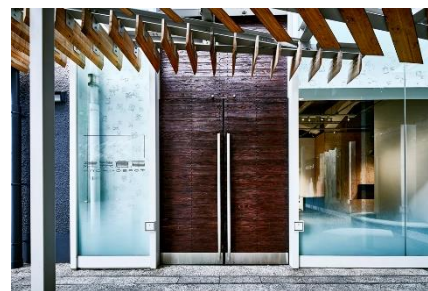
建築倉庫ミュージアム イメージ

また、ミュージアムに隣接する模型保管庫では、建築家や設計事務所から 500 作品以上の模型をお預かりしており、倉庫見学も開催。