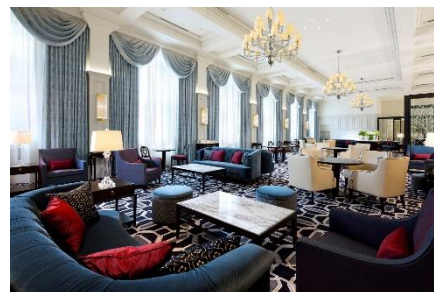
2012 年に誕生した(ロビーラウンジ) イメージ

2015 年に海外のホテルグループ「スモール・ラグジュアリー・ホテルズ・オブ・ザ・ワールド」に東京初ホテルとして加盟、世界的なホテル格付けの「フォーブス・トラベルガイド」にて 2016 年から 4 年連続 4 つ星を獲得。