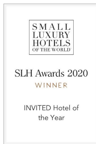
受賞ロゴ「INVITED Hotel of the Year」

SLHアワードは会員顧客やラグジュアリーホテルを扱う海外の旅行代理店の投票、SLHの覆面調査の評価、そして今回はラグジュアリー雑誌や料理専門家などからの投票により、90カ国520以上の加盟ホテルの中から各部門に最もふさわしいホテルを選定しています。最優秀ホテル賞のほか、最も個性溢れるホテル賞、最優秀インテリアデザイン賞などのアワード部門があり、それぞれのカテゴリで高い評価を得た18ホテルが表彰されました。このアワードは2015年から始まり、2017年、2018年、そして第4回目として2020年9月29日に発表されました。