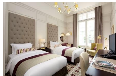
「パレスサイドスーベリア ツイン」

ホテル HP: https://www.tokyostationhotel.jp/stay/plans/details/gototravel_simplestay_bf_at/