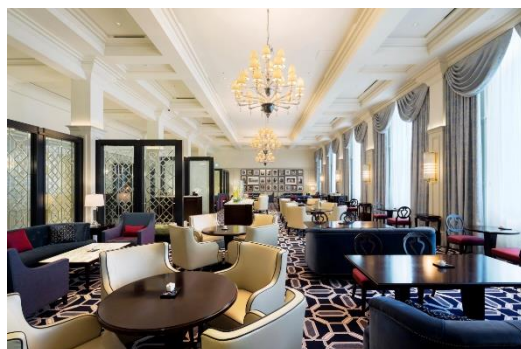
香り豊かなフレイバーパーティーなどを味わえる〈コピーラウンジ〉