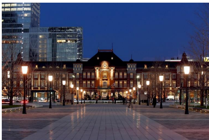
国の重要文化財・東京駅丸の内駅舎の中にある東京ステーションホテル

東京駅丸の内駅舎の中に位置する東京ステーションホテル（所在地：東京都千代田区丸の内1-9-1）は、当ホテルが加盟しているホテルブランドグループの「スモール・ラグジュアリー・ホテルズ・オブ・ザ・ワールド（以下SLH）」が発表したSLHアワード2020において、「INVITED Hotel of the Year」（最優秀 INVITED [インバイテッド] ホテル賞）を受賞いたしました。前回2018年の「最優秀グルメホテル賞」に続き、日本のSLH加盟ホテル（現在13ホテル）でSLHアワード2020の受賞は唯一となります。